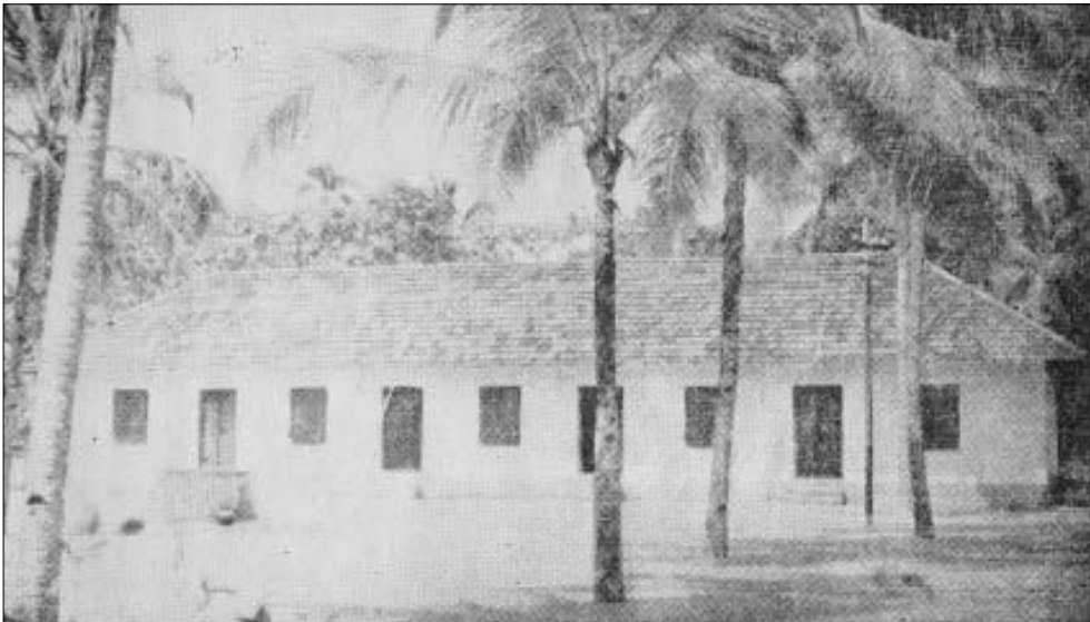
ശ്രീനീലകണ്ഠതീർത്ഥപാദവിലാസം സ്പെഷ്യൽ സംസ്കൃതസ്കൂൾ